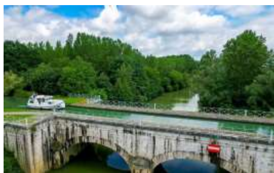
Le pont Canal de la Baïse

Embarquement vers 10h au Mas d'Agenais pour une journée à bord de la péniche Wakaï. Passage des écluses et arrêt pour prendre le temps de déjeuner à bord. Reprise de la navigation vers Buzet sur Baïse après le déjeuner. Arrêt pour admirer le pont canal sur la Baïse .