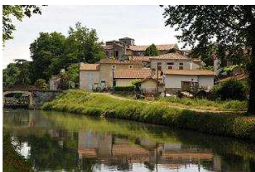
Le Mas d'Agenais